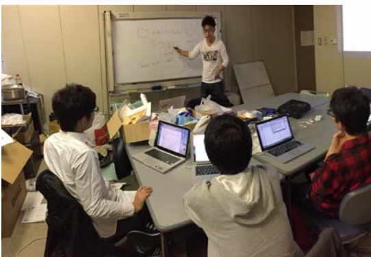
技術勉強とアイデア発想